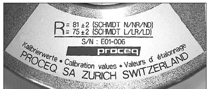
Fig. 4 Schild mit Angabe der Kalibrierwerte Sticker displaying calibration values