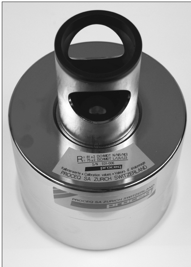
Fig. 2 EURO-Amboss / EURO-Anvil

Durch die Erhöhung der Härte von HRC 28 auf HRC 52 werden die Messwerte auf die Dauer stabiler. Der Rückprallwert steigt jedoch nur um ca. ein R (von 80 auf 81 für N-Hammer, von 74 auf 75 für L-Hammer). Das war auf Grund der Rückprallwerte, welche auf dem Basisamboss mit ähnlicher Härte wie der EURO-Amboss erzielt werden, zu erwarten. Ein anderes wichtiges Kriterium um stabile Werte innerhalb der erwarteten Toleranzen auf dem Amboss zu garantieren ist die Form der Schlagfläche. Wie bekannt, haben unsere Ambosse die spezielle sphärische Form, angepasst an der Form der Schlagfläche des Schlagbolzens des ORIGINAL-SCHMIDT Hammers. Der neue EURO-Amboss hat die gleiche sphärisch geformte Schlagfläche, obwohl dieses Kriterium in der EN 12504-2:2001 nicht erwähnt ist. In den folgenden Bildern ist die sphärische geformte Schlagfläche und der neue Bereich der Kalibrierwerte angegeben.